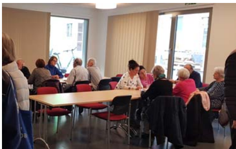
Unsere neuen hellen Kursräume mit moderner Infrastruktur

Daten Computer 12.8./26.8./9.9./23.9./ Anwenderprobleme: 21.10./4.11./18.11./2.12.2020